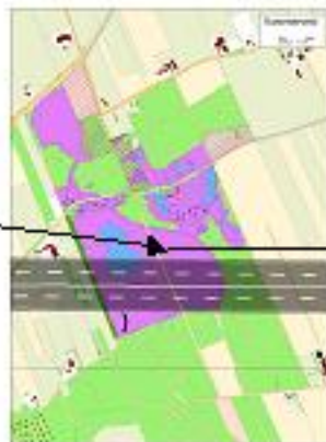
Natuurherstelplan + Tracé vierbaans snelweg.